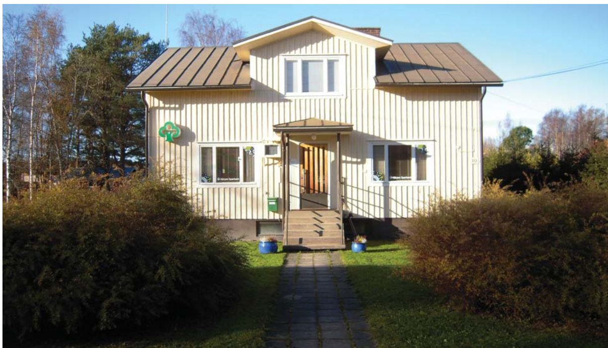
Andelsbanken hade verksamhet i byn 1956-93. Sparbanken verkar i detta hus sedan 1960