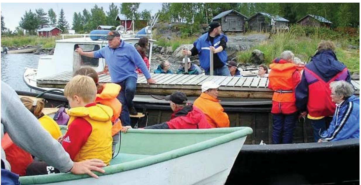
Fiskargillet och uf har de tre senaste somrarna ordnat en utflyktsdag till Märigrund. Ett sätt att öka intresset för skärgården och det kulturarv den gömmer på

Kustremsan är lång och skärgårdsöarna många. Grytskär på 7 km 2 är den största och samtidigt också den största ön i Närpes. Därtill finns 33 öar som överstiger en hektar. Halvön Börskär, Hästskär och Grytskär gömmer ännu på spår av fäboddrift i form av bl.a. några fäbodrar. De forna slätter- och betesmarkerna med sin speciella flora börjar tyvärr vara ett minne blott. En blomma som på Åland kallas Närpesblomman skall växa på Grytskär, men växtarten är höljid i dunkel. Många skär har ett rikt fågelliv liksom Norkfladan. På fiskfredade områden har jaktförbud rått sedan 1936. Grytskärs västra strand står med djävulsåkrar och mäktiga klippor som möter havet med Sverige som granne i väster. Namn som Södran hamnen, Nörr hamnen och Fattigbössan hänför sig till sjöfarten i gången tid liksom kanske jungfrudanser och kompassros. Ryssugnar och begravningsplats vittnar om krig och ofärdstider på samma sätt som minnesmärket över omkomna på Riipelalinjon och hållristningar från Krimkriget på Märigrund – det gamla fiskeläget i yttersta havsbandet med sin karga och specifika natur. Här finns förutom fiskarstugorna också en fyr och ett litet fiskemuseum.