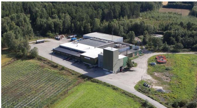
Nä-Rö som startades år 1964 har om- och tillbyggs i flera revideringar och har 6,5 personer anställda

Trevande försök till pälsfarmning gjordes redan på 1930-talet. I slutet av 50-talet kom farmningen i gång på nytt. Privata foderkök byggdes och foderköket Nä-Rö i form av aktiebolag kom i gång år 1964. Farmer har funnits på ett fyrtiotal gårdar, men år 2000 hade antalet sjunkit till 10 och till endast 3 st år 2009. 1970-talets hönsboom kom att beröra 30-talet jordbrukare. Överproduktionen redan i början av 1980-talet åstadkom en nedgång i antalet farmer efter hand. År 2009 var antalet höns gårdar tre.