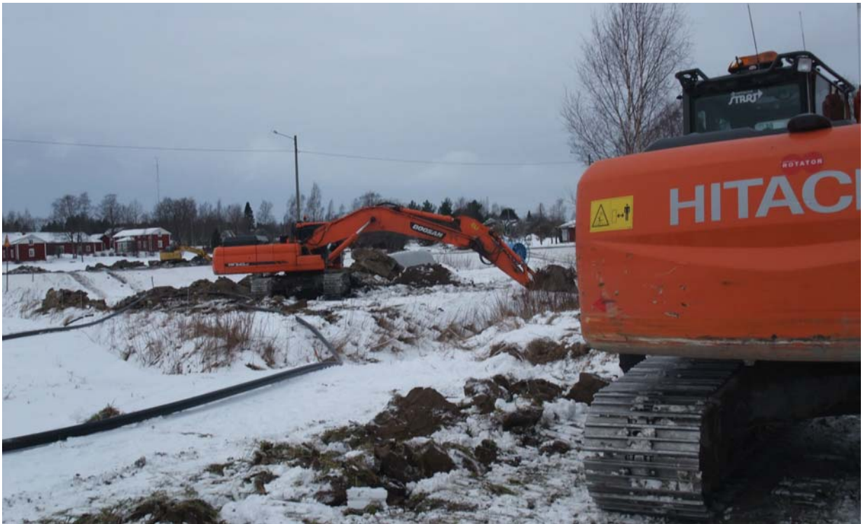
Utbyggnaden av det kommunala avloppsnätet nådde Norrnäs senhösten 2012.