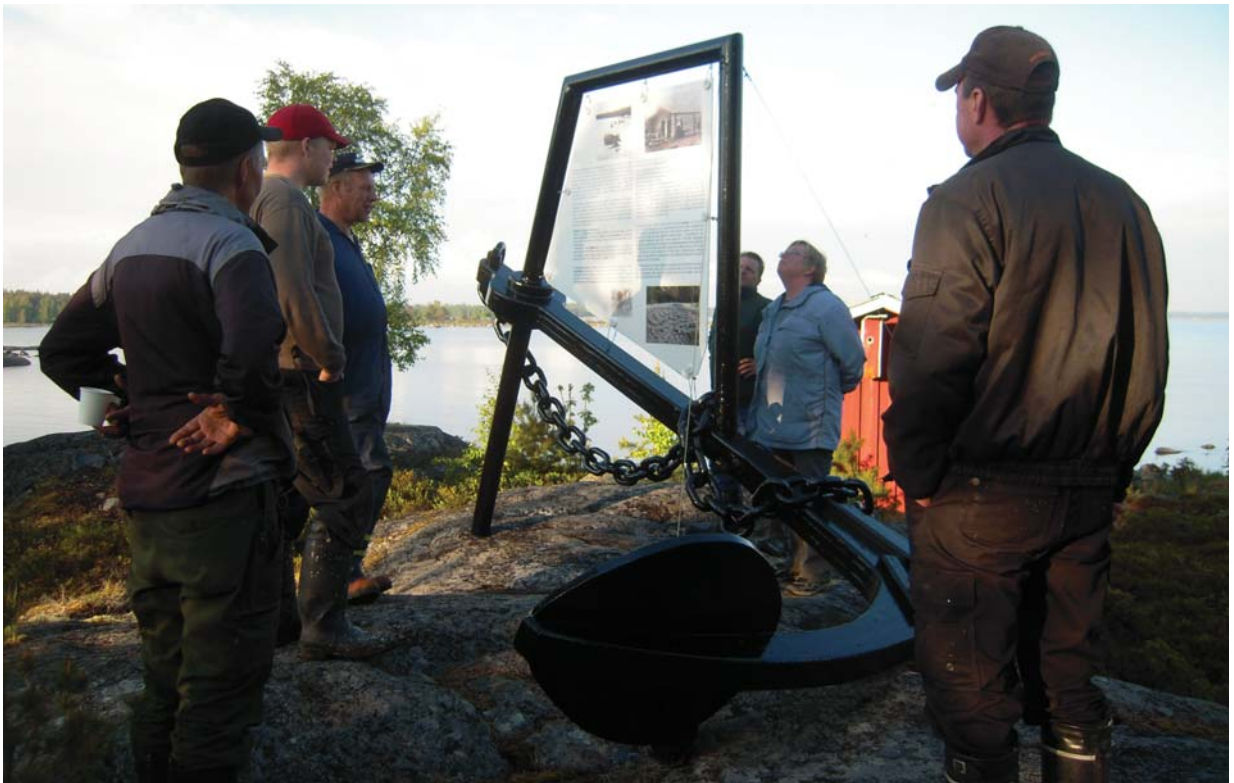
Talkojobbare på Märigrund inspekterar det nyuppsatta "infoankaret" sommaren 2012. Ett likadant ankare finns också på Verkbacken, båda har kommit till i Trivselprojektet