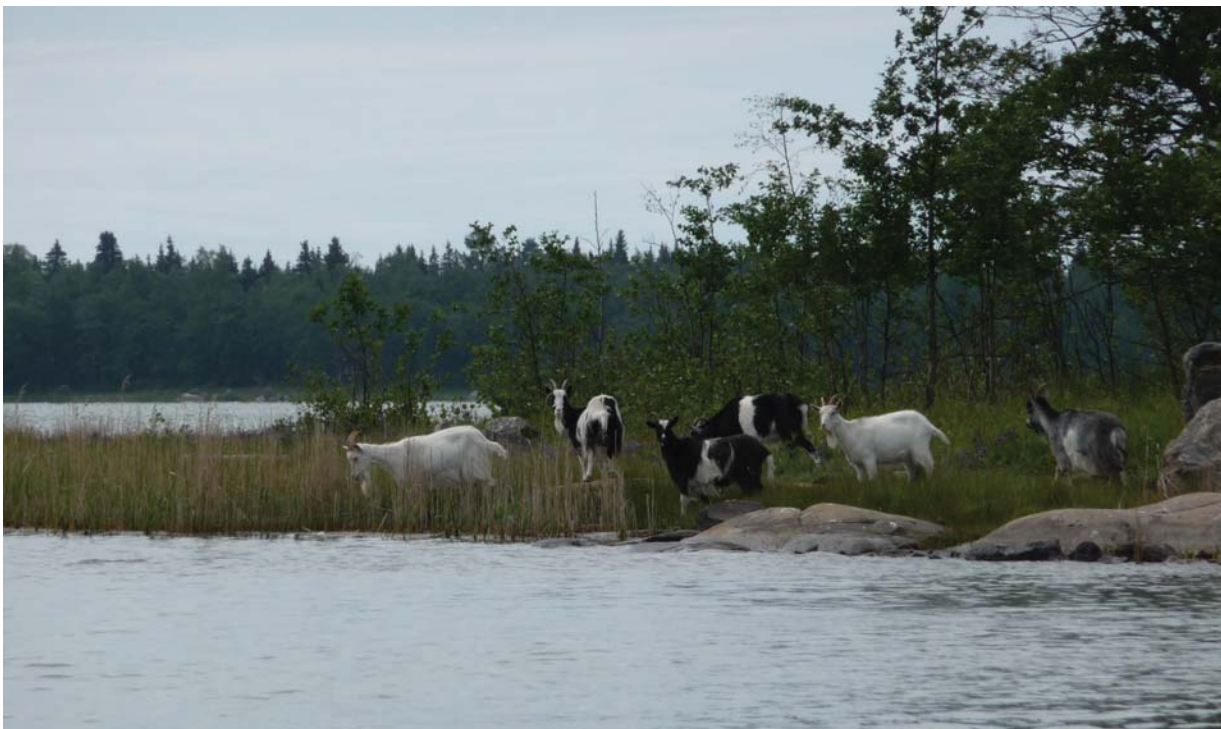
Betande djur på holmar och strandängar gynnar ett naturligt växt- och djurliv i skärgården

I samband med att Natura 2000-avtalet ingicks, togs också initiativ till att höja vattenståndet i Norkfladan för att förbättra miljön. Detta bör fullföljas.