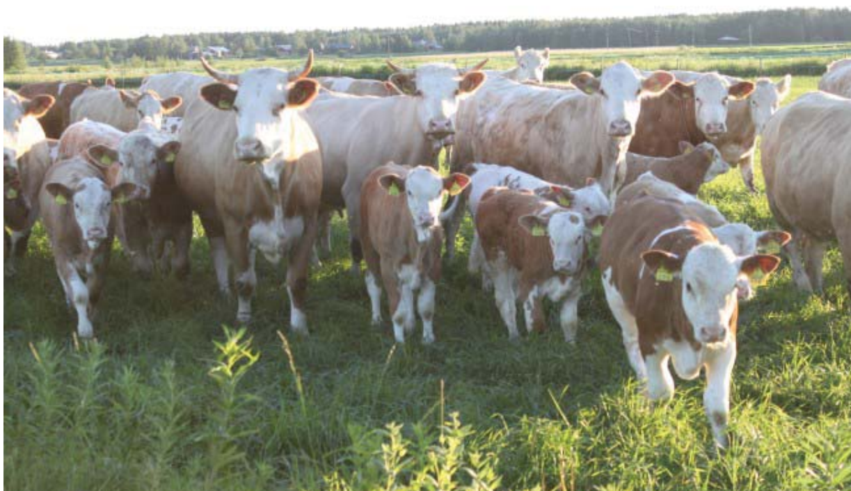
Räfbackens ranch har nått nationella framgångar med sina avelsdjur av rasen Simmental.

Samma är fallet med strandängarna vid Nässkatan, där vi, om vi på Strandvägen kommer från norr, får en första blick av byn som strandby. Nässkatudden är en viktig rastplats för flyttfåglar vår och höst.