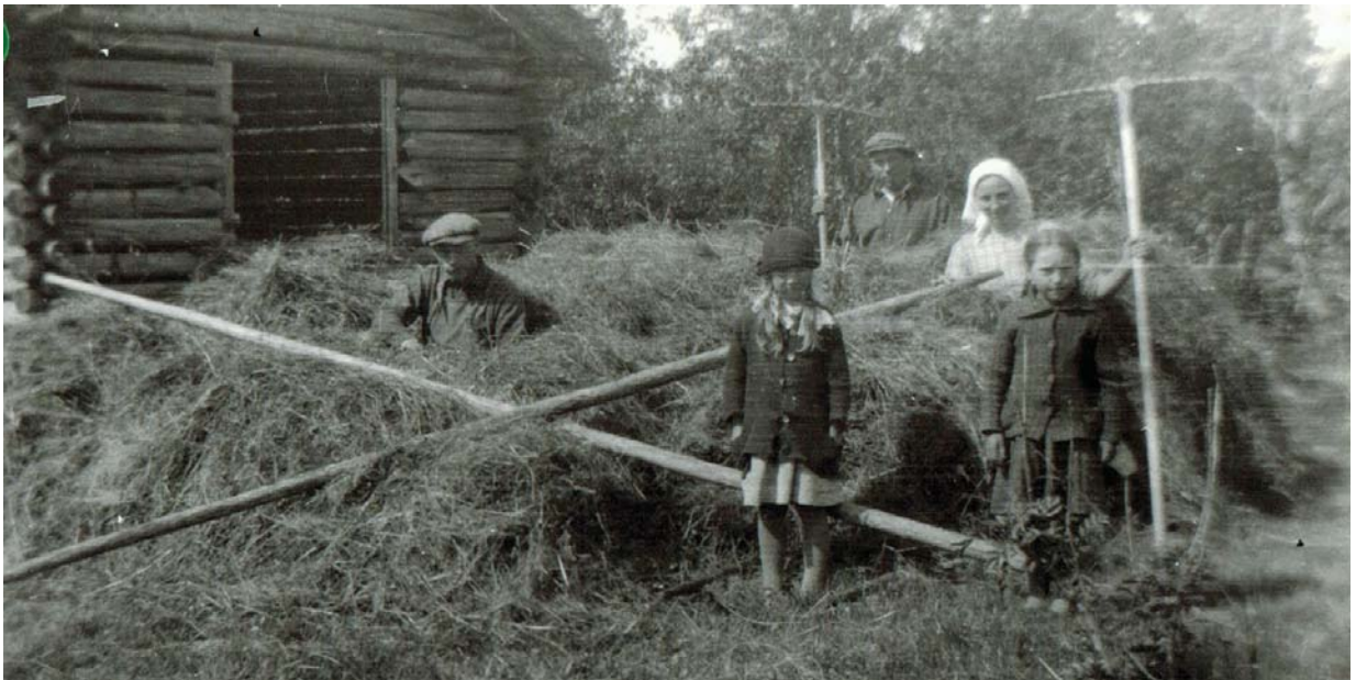
Slätter och betesdrift i skärgården är ett minne blott, men ännu finns några lador och fäbodrar kvar.

Kustremsan är lång och skärgårdsöarna många. Grytskär på 7 km 2 är den största och samtidigt också den största ön i Närpes. Därtill finns 33 öar som överstiger en hektar. Halvön Börskär, Hästskär och Grytskär gömmer ännu på spår av fäboddrift i form av bl.a. några fäbodrar. De forna slätter- och betesmarkerna med sin speciella flora börjar tyvärr vara ett minne blott. En blomma som på Åland kallas Närpesblomman skall växa på Grytskär, men växtarten är höljid i dunkel. Många skär har ett rikt fågelliv liksom Norkfladan. På fiskfredade områden har jaktförbud rått sedan 1936. Grytskärs västra strand står med djävulsåkrar och mäktiga klippor som möter havet med Sverige som granne i väster. Namn som Södran hamnen, Nörr hamnen och Fattigbössan hänför sig till sjöfarten i gången tid liksom kanske jungfrudanser och kompassros. Ryssugnar och begravningsplats vittnar om krig och ofärdstider på samma sätt som minnesmärket över omkomna på Riipelalinjon och hållristningar från Krimkriget på Märigrund – det gamla fiskeläget i yttersta havsbandet med sin karga och specifika natur. Här finns förutom fiskarstugorna också en fyr och ett litet fiskemuseum.